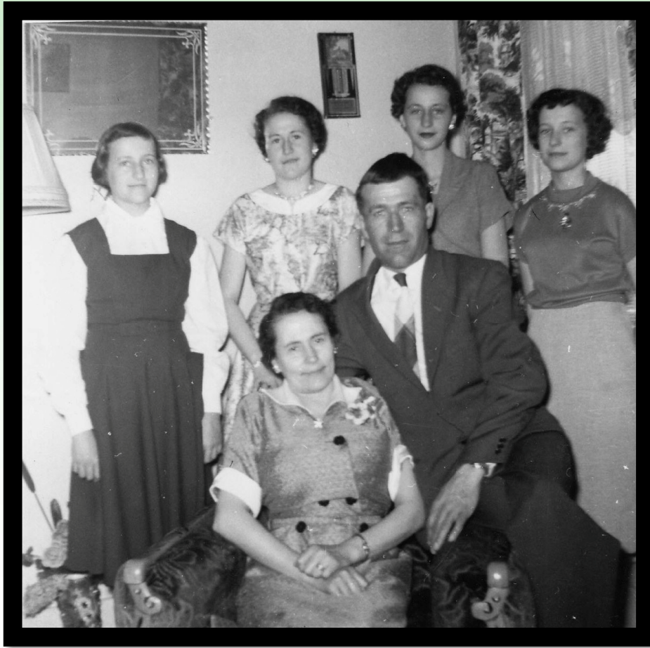
La famille complète.