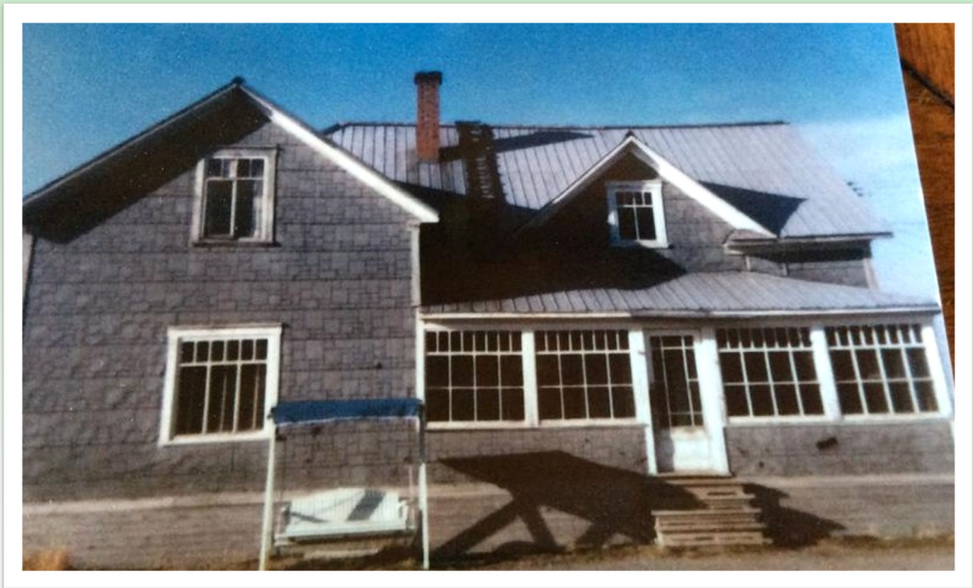
Maison familiale dans le rang 9