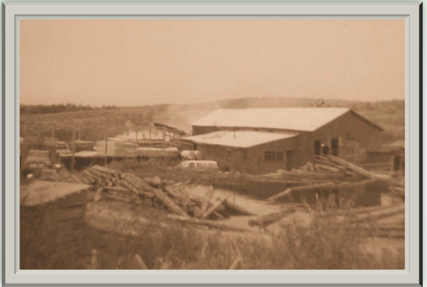
Moulin au village