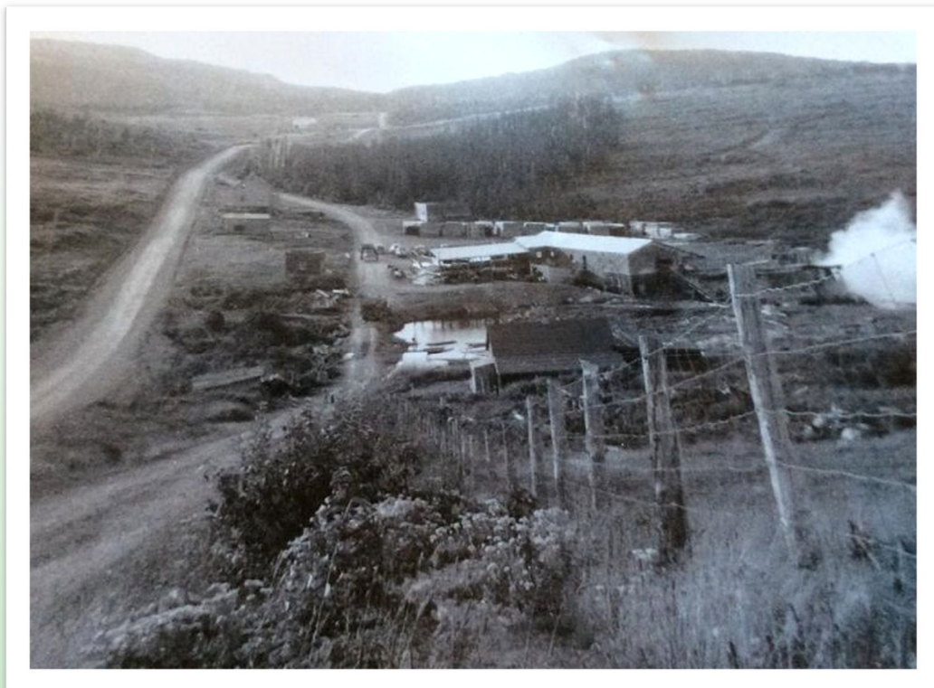
Moulin dans le rang 9